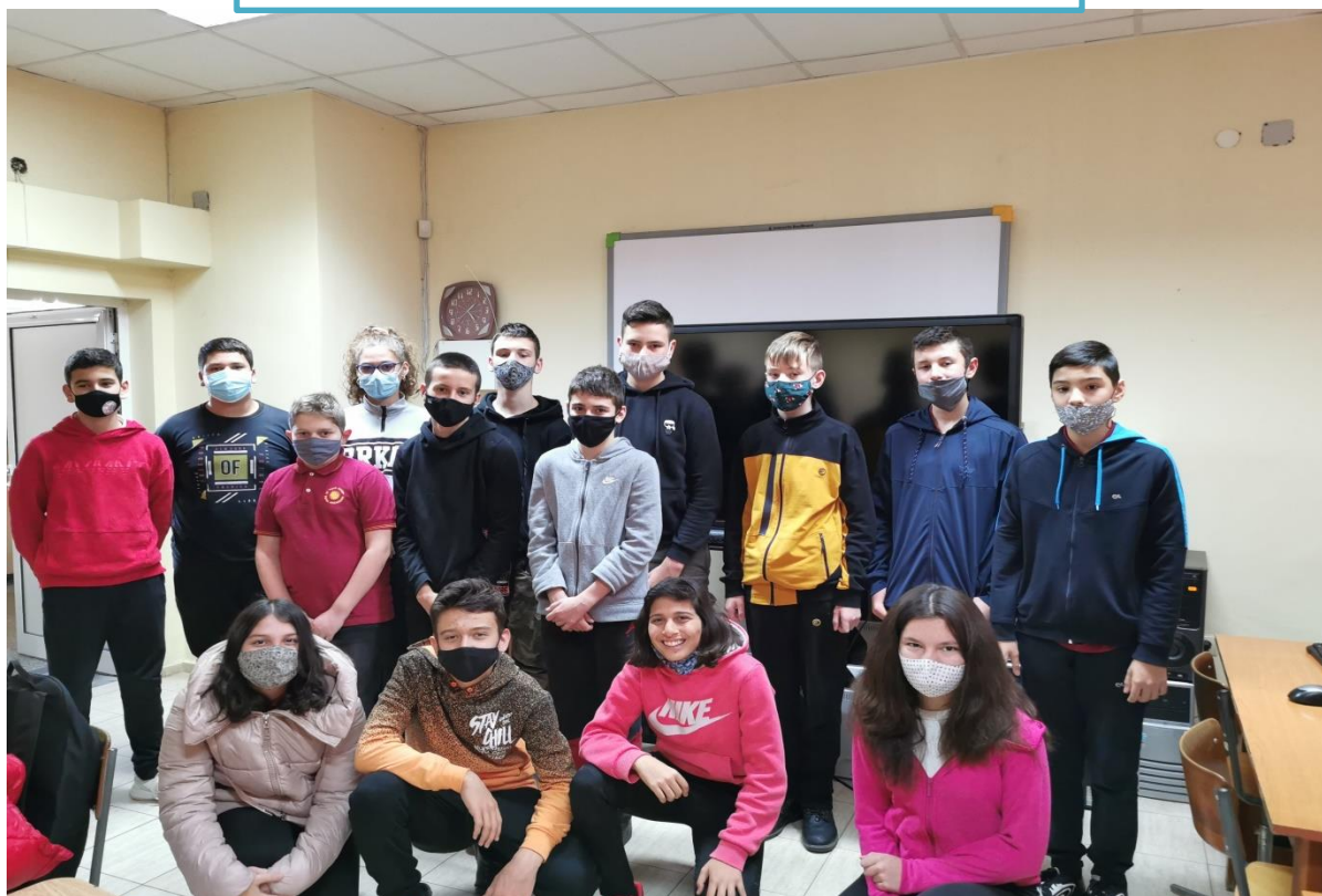
По време на пандемията!!!

Щастливи сме, че участвахме в проекта Образование за утрешния ден, който ни помогна да разширим нашите умения и знания в областта на компютрите. Научихме се да бъдем организирани, да работим в екип и да преодоляваме трудностите и да не се страхуваме от предизвикателствата в съвременния дигитален свят.