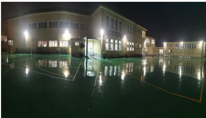
ОУ „Иван Вазов“