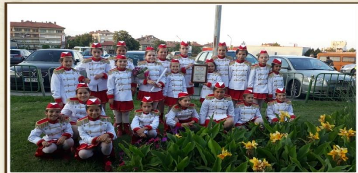
Детски фестивал на изкуствата "Раховче", 2019 г.

Мажоретният състав при Основно училище „Иван Вазов“, гр. Горна Оряховица е създаден през месец януари, 2019 година като Клуб за занимания по интереси в ОУ „Иван Вазов“.