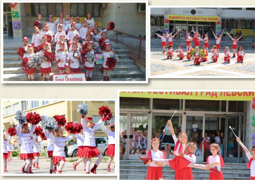
Мажоретен фестивал в град Левски, 2019 г.