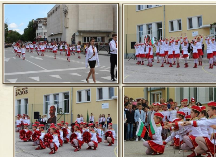
24 май, 2019 г.

В категорията „Традиционал-батон“ състезателките спечелиха и купа за трето място.